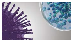
nanoe™ X fanger forurensning.

Egenskapene til nanoe™ X sørger for at flere typer forurensning kan deaktiveres, for eksempel visse bakterier, virus, mugg, allergener, pollen og noen skadelige stoffer.