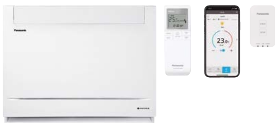
CZ-TACG1 Panasonic WLAN- modul for internettstyring.