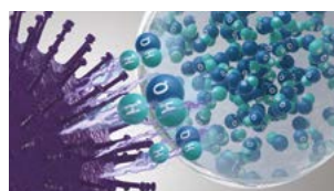
Hydroksylradikaler denaturerer proteinene i forurensende stoffer.