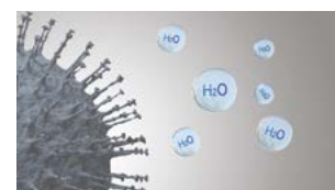
Aktiviteten til forurensende stoffer hemmes.